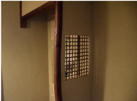
床の間 Japanese TOKONOMA