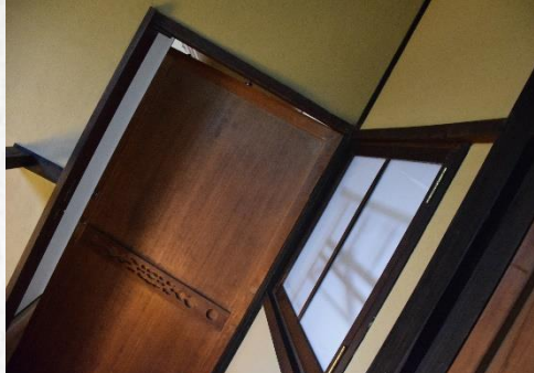
お部屋への入り口 Room Entrance Door