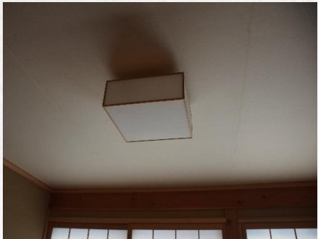
和紙製の照明 Japanese WASHI ceiling view