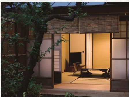
坪庭からの夜景 Viewing the Room at Night