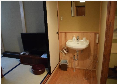
洗面台 En-suite washing sink view