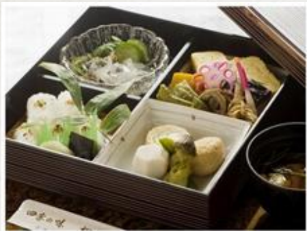
朝食 京仕出弁当 Japanese bento breakfast

部屋サイズ: 6.5畳 Room size: 6.5 Japanese tatami Square