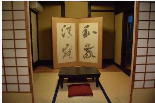
室内 Inside the Guest Room