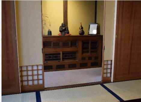
部屋からの眺め Viewing the Main Entrance