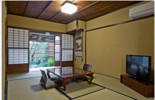
室内 Japanese Lounge Room