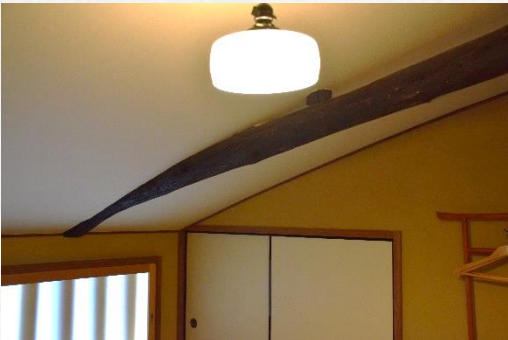
室内 Inside the Room