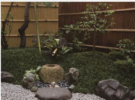
坪庭 Japanese Garden