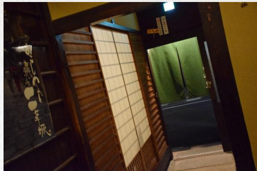
お部屋への入り口 Room Entrance Door