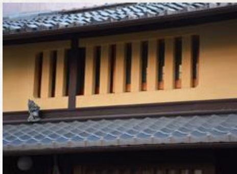
虫籠窓 Room External Windows