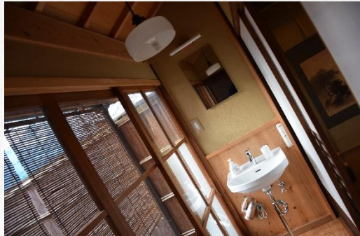
洗面所 En-suite Washing Sink