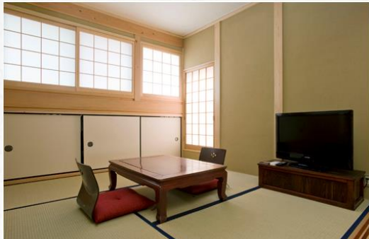
6.5畳の和室 Japanese Lounge Room