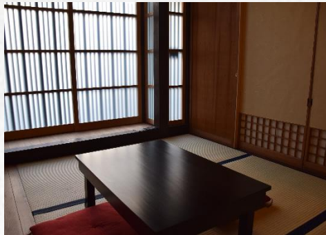
4.5畳の和室 Japanese Lounge Room