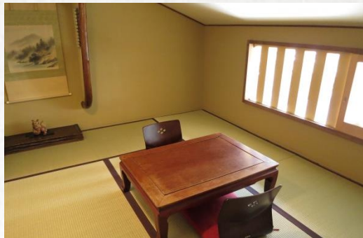
6畳の和室 Japanese Lounge Room